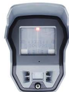
RÖRELSEDETEKTOR MED FÄRGKAMERA OCH NATTBELYSNING UTOMHUS