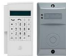
KONTROLLPANEL FÖR ETABLERING SAMT UTOMHUSLÄSARE FÖR KORT/TAGG.